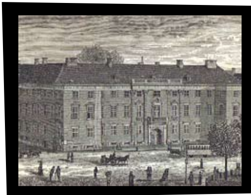
Charlottenborg i København omkring 1875 Fra: J.P. Trap, Kongeriget Danmark , 2. udgave 1879