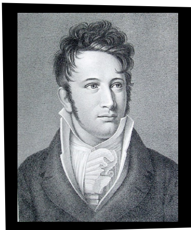
Adam Gottlob Oehlenschläger (1779-1850)